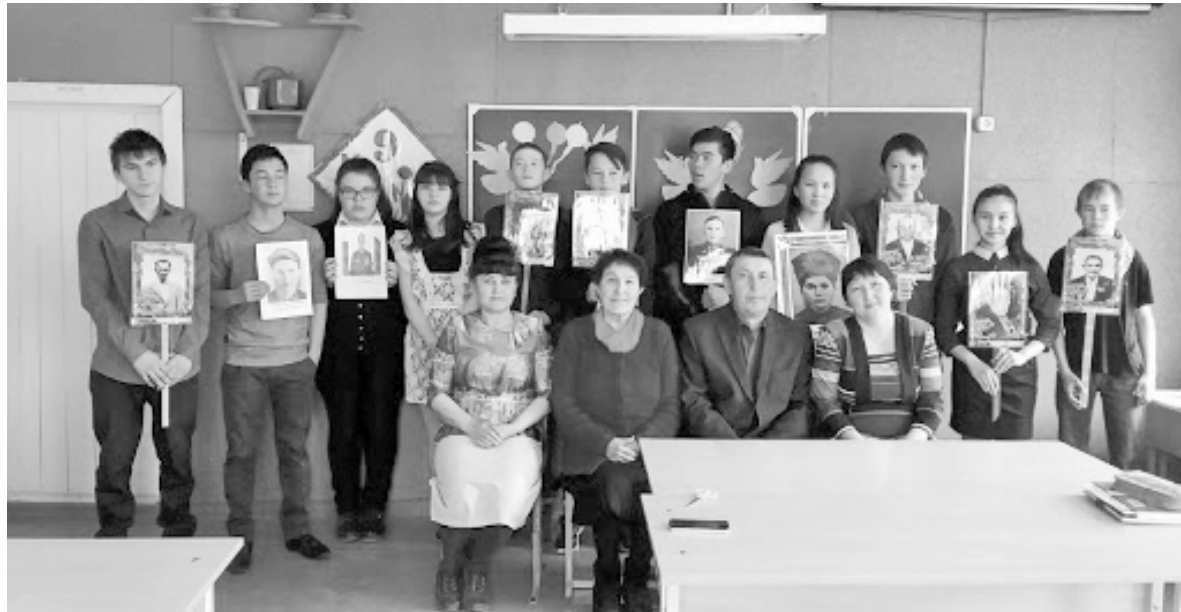
В Аксурской школе чтят память старшего поколения

В основе работы педагогического коллектива и первичной организации РДШ – программа «Наш край», целью которой является воспитание гражданских качеств наших детей через уроки, внеклассные мероприятия, сотрудничество с учреждениями и организациями села – школой и сельской библиотеками, школьным краеведческим музеем «Память», сельским домом культуры, первичной ветеранской организацией, администрацией поселения. Особенно ценно участие ветеранов труда, педагогов-ветеранов в пропаганде ге-