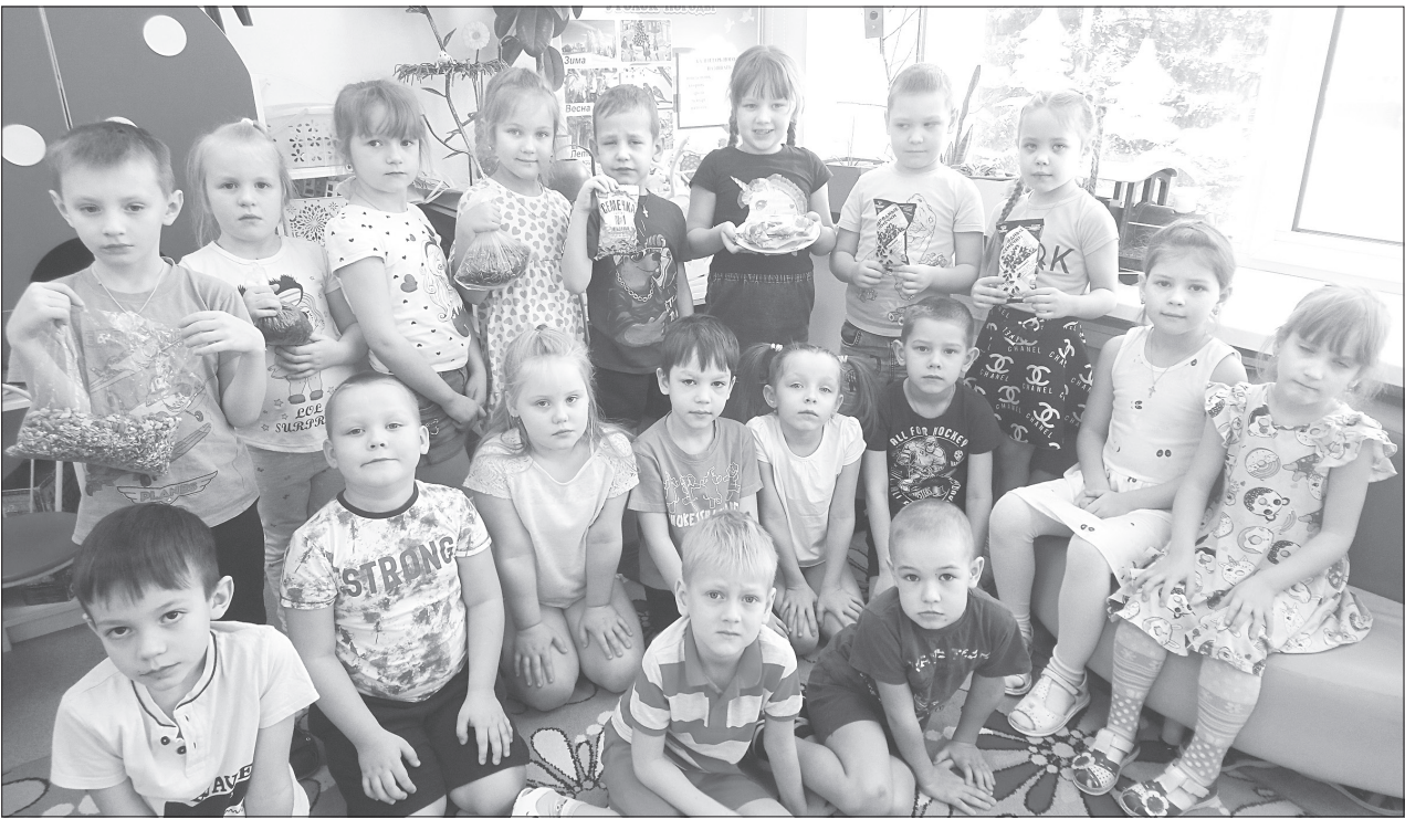
Воспитанники старшей группы «Умники и умницы» с угощением для птиц

* * * Зима наступила, Мороз обжигает, На ветке синицы сидят. - Где бы согреться, Чего бы покушать? - Между собой говорят. Вдруг воробей Озорной подлетает: - Летите скорее за мной, Столовая птичья