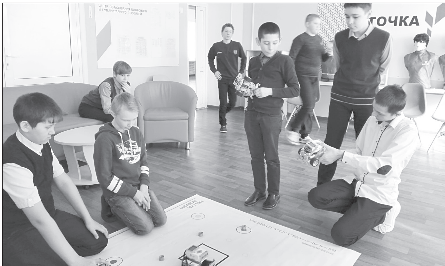
К сражению готовятся команды из Ивановки и Беркута

Юные сельские конструкторы выяснили, чьи роботы быстрее ездят и передвигают предметы