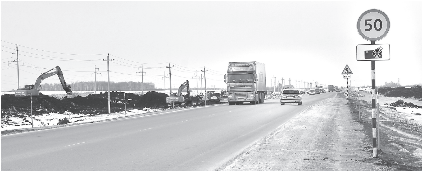
Масштаб сделанных вдоль «федералки» работ уже впечатляет, хотя это всего лишь подготовка к реконструкции

По их словам, весна и лето уйдут на замену слабых грунтов, поэтому работы будет много, а следовательно, до установки разделительного отбойника в этом году дело, скорее всего, не дойдёт. Сейчас на участке с 64 по 74 километр установлены знаки, ограничивающие скорость до 50 км/ч. В дальнейшем аналогичный режим введут на отрезке с 39-го по 56-й. На этот год также запланирован ремонт участков дорог Петелино – Заводопетровское, Ялуторовск – Ярково, Шадринск – Ялуторовск и подъезда к селу Коктюль.