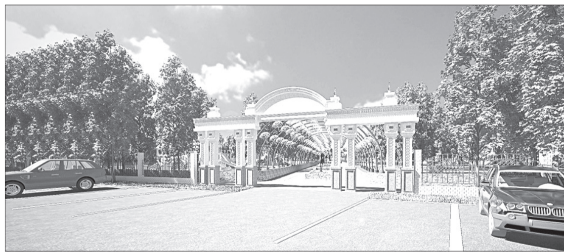
Один из вариантов оформления входа в парк предусматривает строительство каменной арки в классическом стиле

Своё мнение по поводу проекта каждый из участников фокус-группы смог выразить, заполнив индивидуальную анкету. В конце апреля, после анализа собранных мнений, состоится ещё одна подобная встреча. На ней обсудят итоговую задумку и сформируют окончательный список необходимых работ.