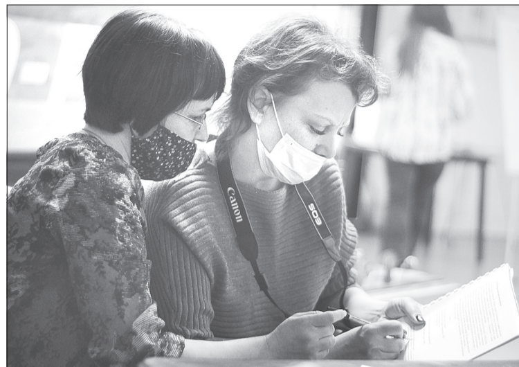
В роли архитекторов выступили воспитатели, учителя, спортсмены, молодёжь и пенсионеры

После прозвучавшей исторической справки о парке, подготовленной сотрудниками музейного комплекса, начался индивидуальный этап разработки. Обсуждение проходило в виде необычной викторины. Всем участникам задавался вопрос, на который нужно было ответить одним словом, написав его на бумаге. К примеру, что нравится в существующем сквере? Люди писали: спокойствие, тишина, аллеи и т. д. Или с какой темой, идеей нужно связать эту рощу, какой объект должен стать главным на территории? Ответы на каждый вопрос собирали по отдельности. Наиболее часто упоминаемые будут в приоритете при разработке концепции.