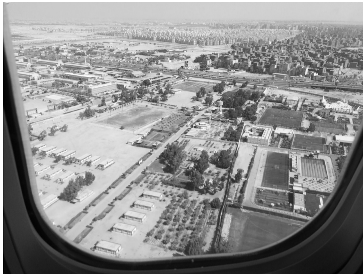
Каир — город цвета пустыни. Ещё несколько минут, и мы приземлимся в столице Египта и одной из самых крупных агломераций мира.

Возвращаясь к примеру, что сейчас можно купить тур в Турцию за 67000 на шесть ночей, отмечу, что, конечно, это сумма не