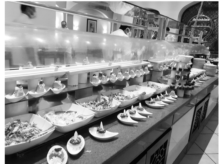
Вот такой «шведский стол», вернее, его небольшую часть я запечатлел на телефон во время своего отдыха. Воспользовавшись программой «всё включено», голодными вы точно не останетесь.