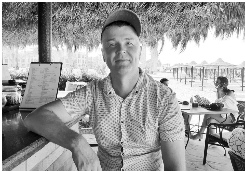
В баре на берегу пляжа можно заказать прохладительные напитки.