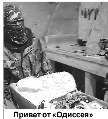
Привет от «Одиссея»