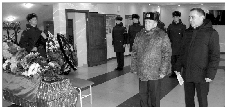
Траурная речь военного комиссара и главы района