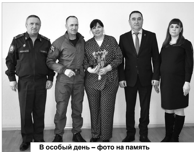
В особый день — фото на память