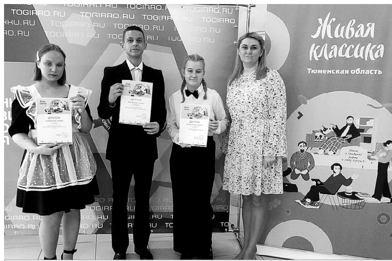
«Мечты сбываются — победа в наших руках!»