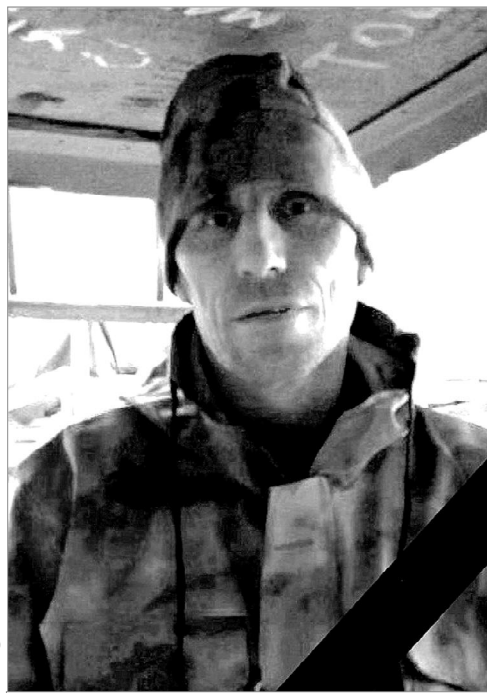
Герой земли Армизонской