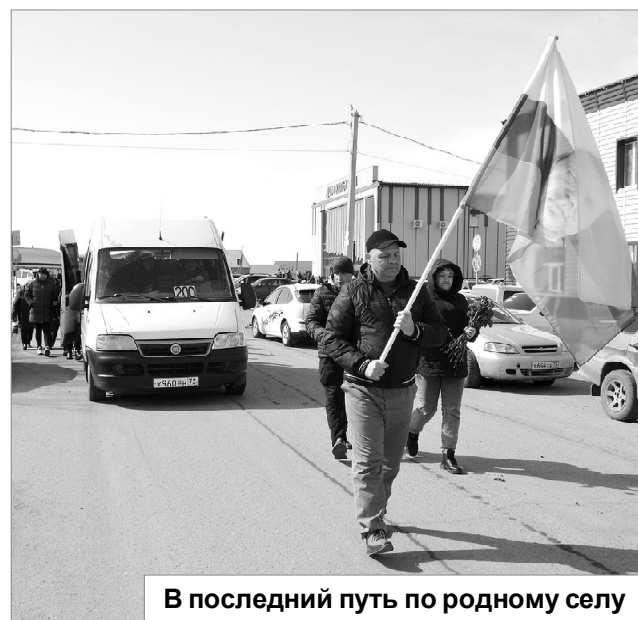
В последний путь по родному селу