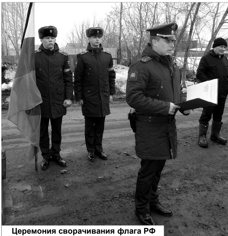
Церемония сворачивания флага РФ