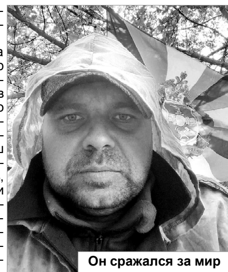
Он сражался за мир