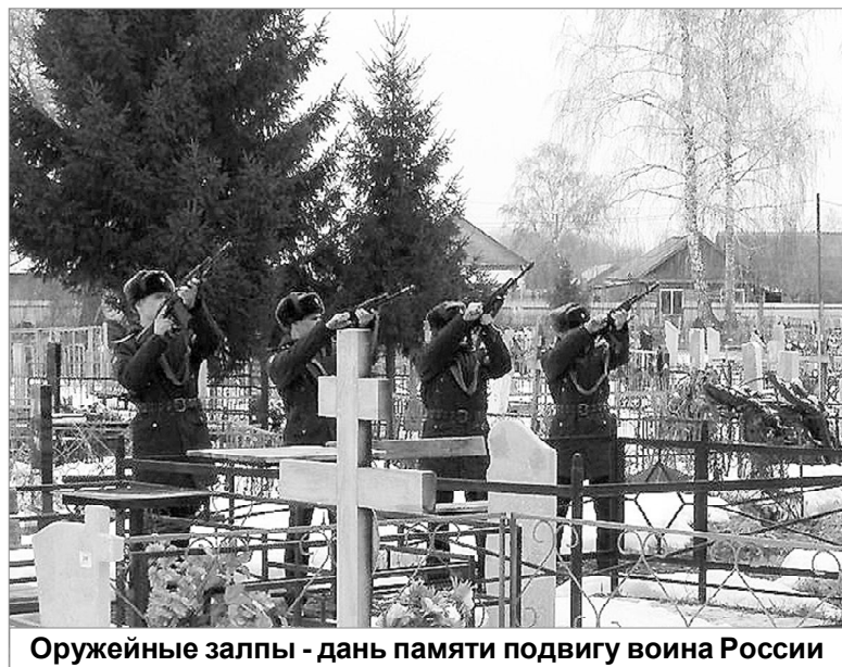
Оружейные залпы - дань памяти подвигу воина России