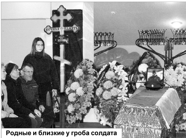
Родные и близкие у гроба солдата