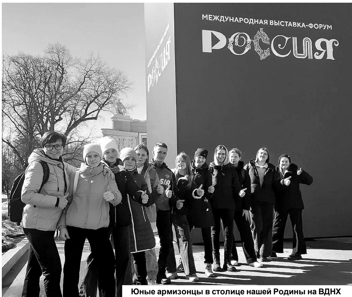
Юные армизонцы в столице нашей Родины на ВДНХ