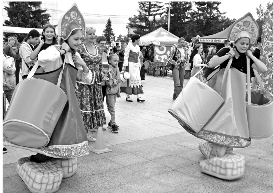
• В русских народных забавах с удовольствием участвовали дети.