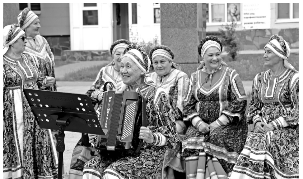
• Русскими народными песнями живёт Россия! В этом твёрдо убеждены участницы заводоуковских вокальных групп, которые стали гвоздём музыкальной программы «Любимому городу посвящается».

Больше фотографий с празднования дня города смотрите на сайте газеты «Заводоуковские вести» https://zavodoukovsk.online/ .