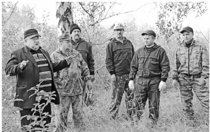
* Ставятся задачи бригаде