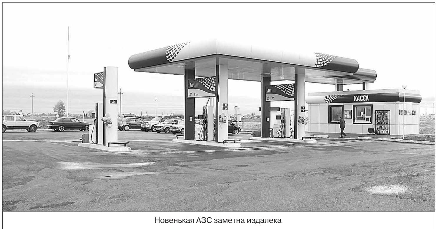
Новенькая АЗС заметна издали