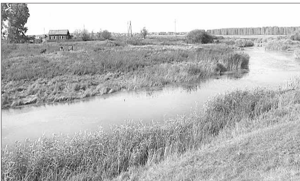
«Я сердцем там, у старенькой избы...»

Любовь АЛЕКСЕЕВА.