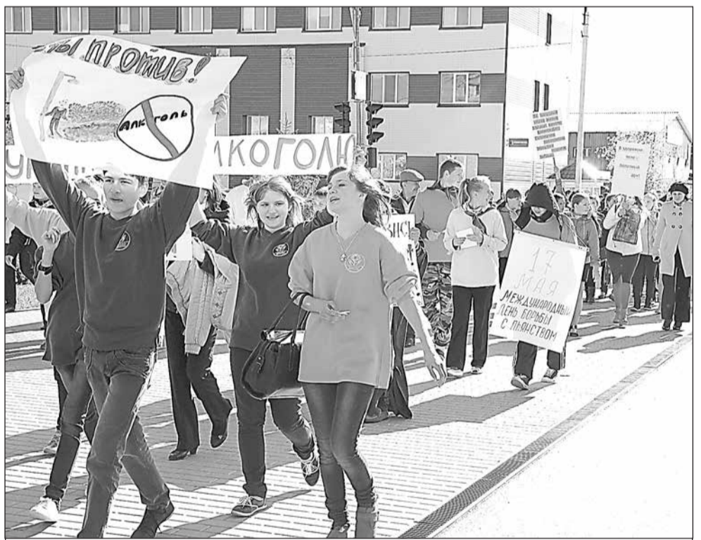
«Мы – против алкоголя!»

В конце сентября учащиеся школ посёлка и студенты Голышмановского агропедагогического колледжа приняли участие в антиалкогольном митинге, приуроченном к прошедшей в области «Неделе трезвости». С плакатами и лозунгами делегации волонтеров и добровольцев преодолели улицы: Садовую, Пролетарскую, Вокзальную, Ленина. Конечной точкой их маршрута стала площадь перед Дворцом культуры «Юность», где прошёл небольшой концерт, посвящённый здоровому образу жизни.