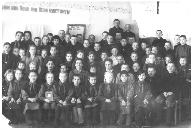
Воспитанники и воспитатели детского дома №28

Продолжение. Начало в «СВ», №73, 7 сентября, №78, 26 сентября