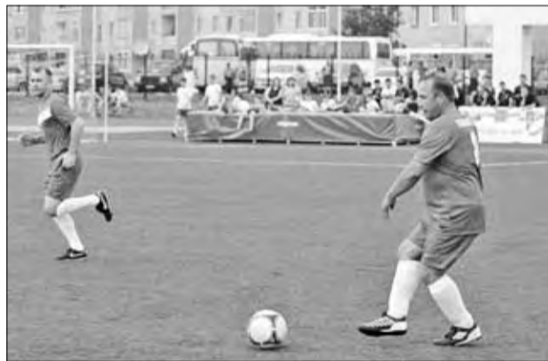
Матч «Под флагом добра»

ством области достигнуто соглашение о выделении дополнительных рейсов. Сейчас население Заболотья не испытывает проблем с авиаперевозками.