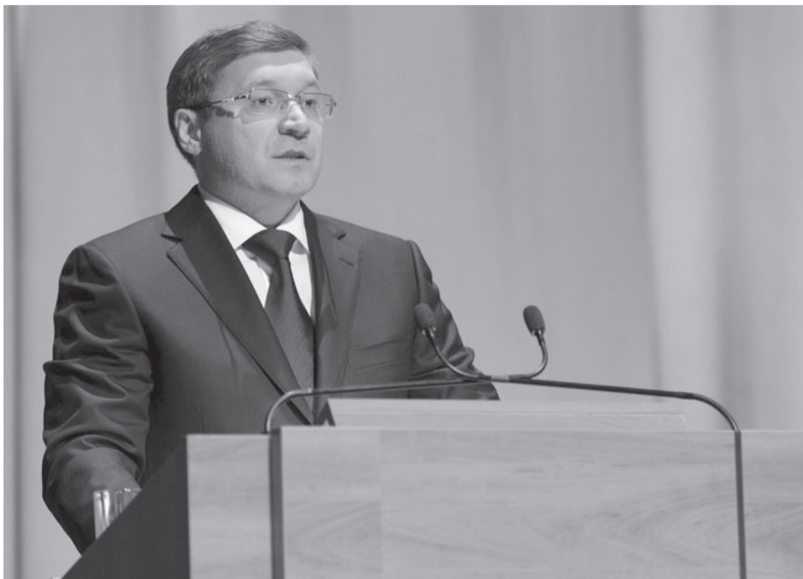
Губернатор Тюменской области Владимир Якушев выступает с Посланием Тюменской областной Думе «О положении дел в области»

Земля эта является неотъемлемой частью России как одного из ключевых элементов мировой «мозаики», включён-