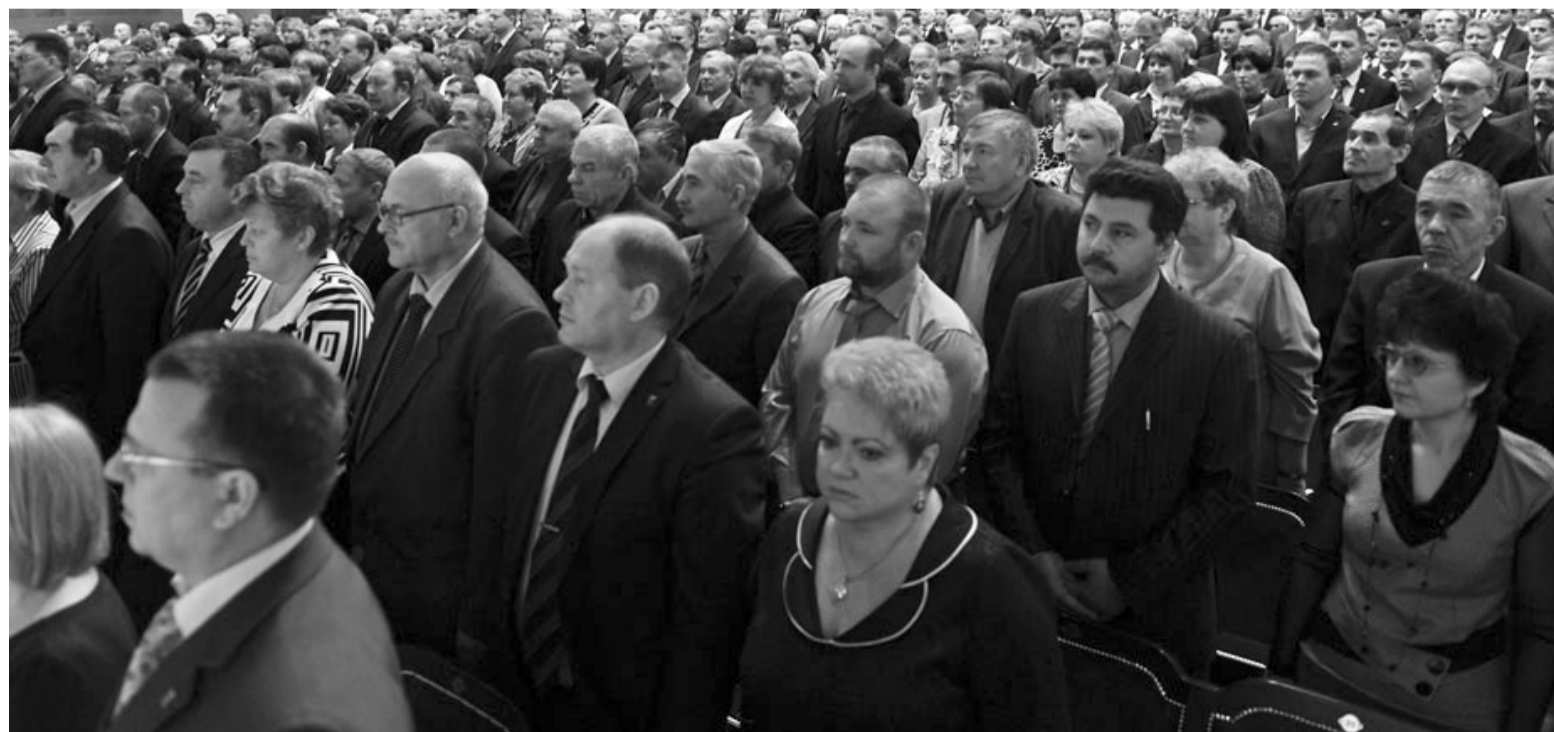
Восьмое расширенное заседание Тюменской областной Думы по традиции началось с гимна Российской Федерации