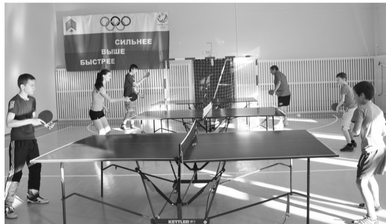
Секция по настольному теннису