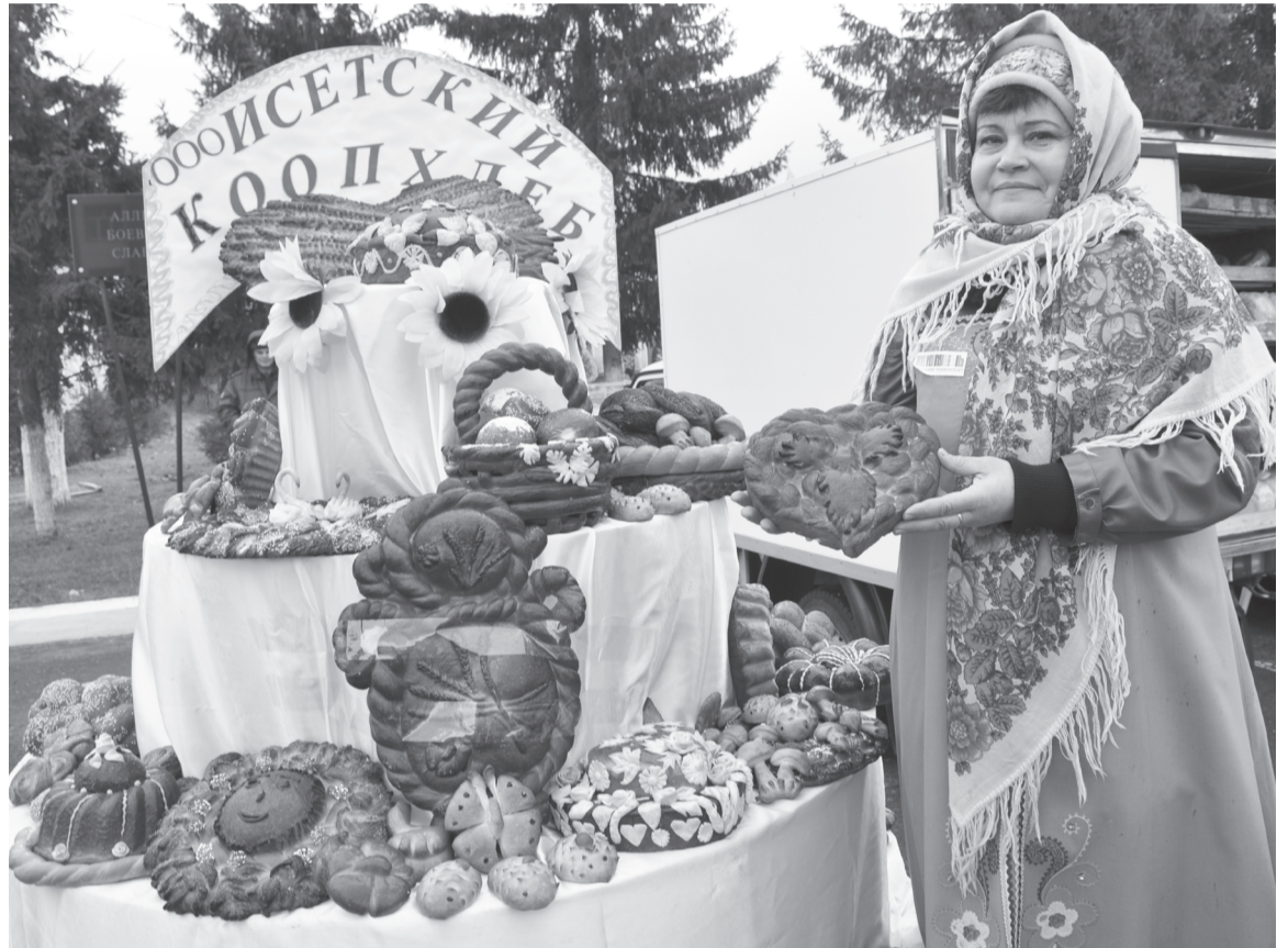
Аромат свежей выпечки ООО «Исетский коопхлеб» манит покупателей