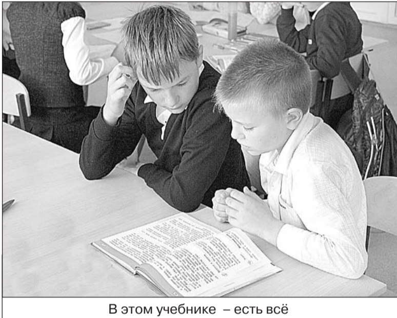
В этом учебнике – есть всё