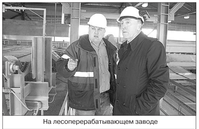
На лесоперерабатывающем заводе