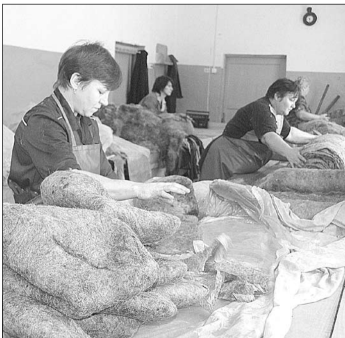
Руки заросшиц отдыха не знают

Катать валенки – настоящее сибирское ремесло. В прежние времена ходили катали и шерстобиты, как называли тогда мастеров, от деревни к деревне со своим нехитрым инструментом, подражались катать валенки на всю семью из шерсти, настриженной хозяйками со своих овец. Сегодня модницы, хоть и щеголяют в фирменных сапожках вокруг ножки, однако в тридцатиградусные морозы обувают мягкие валеночки, благо они сейчас на любой вкус: с вышивкой и кружевами, со шнуровкой и стразами. Производство, где выпускают валенки, не так много, по югу Тюменской области Голышмановский цех ИП Овсянникова, пожалуй, единственный.