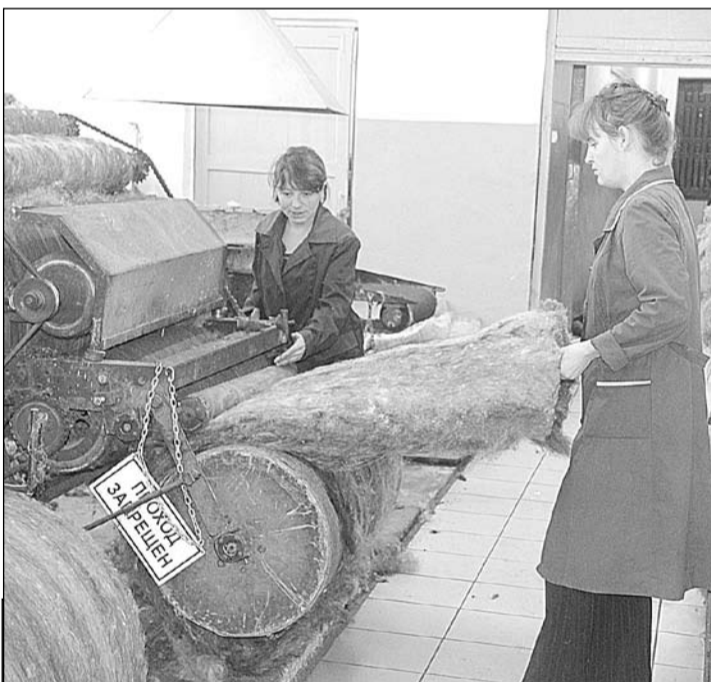
Крутится барабан чесальной машины