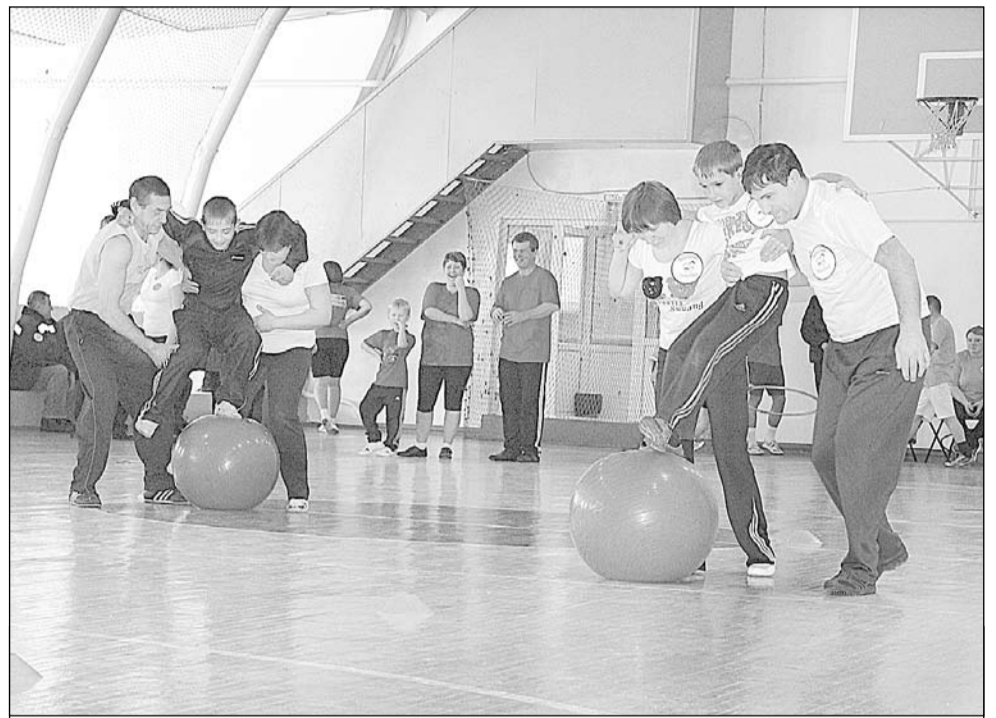
В конкурсах и проявляется сплочённость семьи

ма, что он устал, нужен перерыв. Важно избегать ситуаций, которые могут спровоцировать срыв: не находиться рядом с курящими, убрать с глаз сигареты и зажигалки и, конечно, не употреблять алкоголь. А за несколько дней или недель без срывов можно придумать себе поощрение. В таком режиме достаточно продержаться две-три недели, а положительный эффект появится уже на четвертый-пятый день: дыхание станет более свободным, появится бодрость. Хорошее самочувствие и настроение – награда за все приложенные усилия.