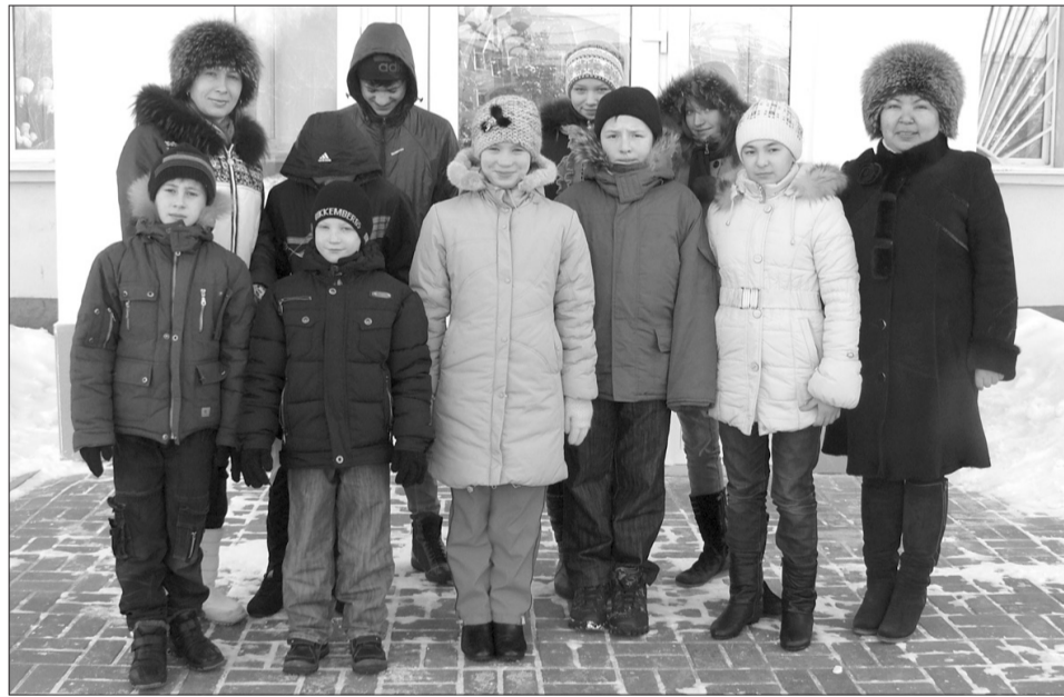
На пороге открытый

строенные на домашний лад. Каждая группа, как большая семья, где старшие заботятся о младших, все вместе они собираются в просторном зале у телевизора, а если захотят побыть в одиночестве, устав от общения, расходятся по своим комнатам, причём у каждого ребёнка отдельная. Есть, правда, исключения из правил. По желанию, двух братьев или двух сестёр могут поселить вместе. В ванных комнатах установлены душевые кабины, несколько умывальников, электрические бойлеры, которые используются в случае отключения в городе горячей воды. Но главная ценность здесь – это стиральные машинки. Воспитатели учат ребят пользоваться ими, разбираться в разных режимах, а заодно и в тканях, из которых пошита их одежда. Несмотря на то, что питаются дети в столовой, убранство которой больше походит на дорогой ресторан, в каждой группе имеется своя кухня с бытовой тех-