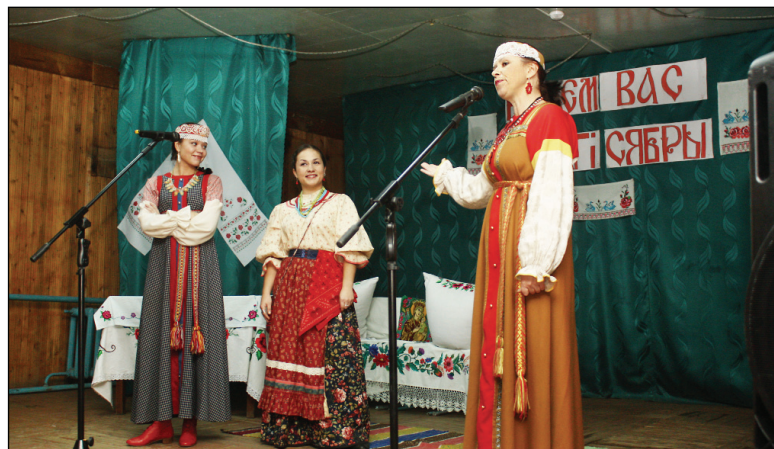
• Гости на сцене.