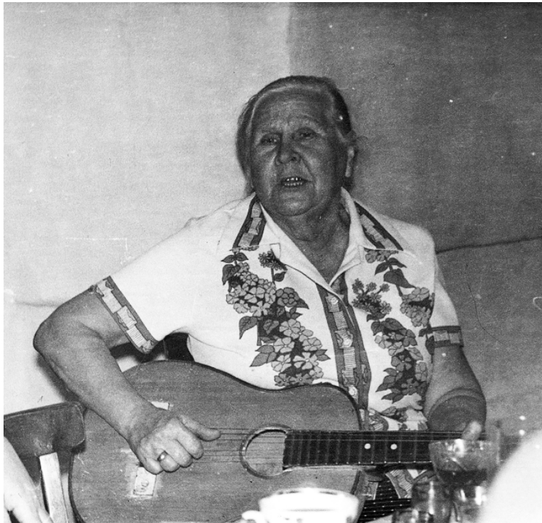
Фото из семейного альбома

специальные комиссии. И ей, девочке рослой и довольномышленной, в ее новую «метрику» была внесена эта дата. А еще она говорила: «Родилась я в хлеву, как Иисус Христос, на соломе. И, наверное, это значило: мол, не жди тепличной судьбы, будь готова к лишениям...».