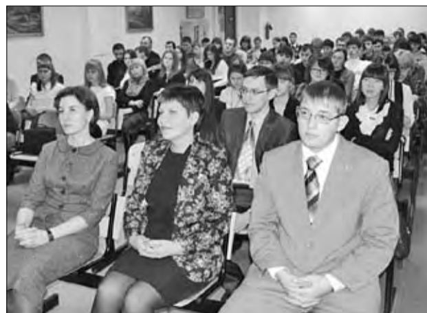
Участники и гости конференции