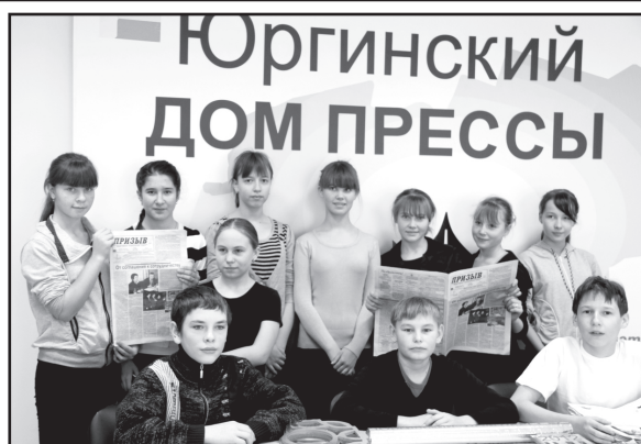
На экскурсии в Доме прессы