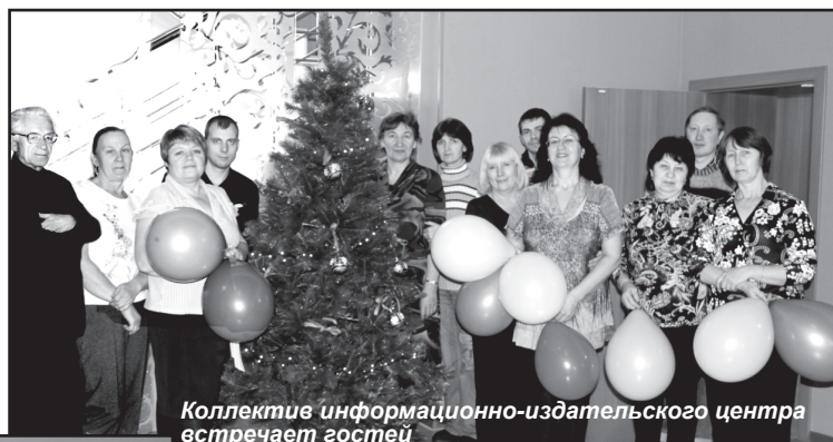
Коллектив информационно-издательского центра встречает гостей