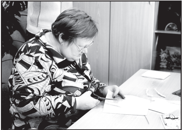
В КЦСОН Юргинского муниципального района

Что включает в себя понятие «социально-культурная реабилитация», какими техническими средствами для людей с ограниченными возможностями здоровья располагает социальная служба района, как ведётся работа по программе «Первый шаг», какие смены организуются по реабилитации, какое санаторно-курортное лечение можно получить – на эти и другие вопросы давались ответы в рамках дня открытых дверей, прошедшего в АУ «Комплексный центр социального обслуживания населения Юргинского муниципального района» в Международный день инвалидов.