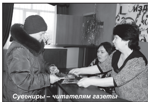
Сувениры – читателям газеты