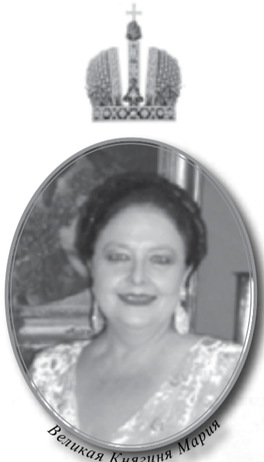
Великая Княгиня Мария