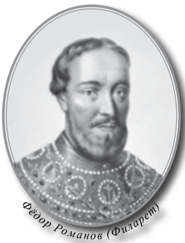
Феодор Романов (Филарет)