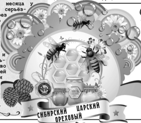
СИБИРСКИЙ ЦАРСКИЙ ОРЕХОВЫЙ

Из отчаявшейся больной женщины-инвалида дочь превратилась в сияющую красотой и здоровьем привлекательную даму. Это средство омолаживает, мы его всей семьей пили и выглядели на все 100! Говорят, наши ученые воссоздали древний рецепт. Правда ли это? Если да, то где можно купить?»