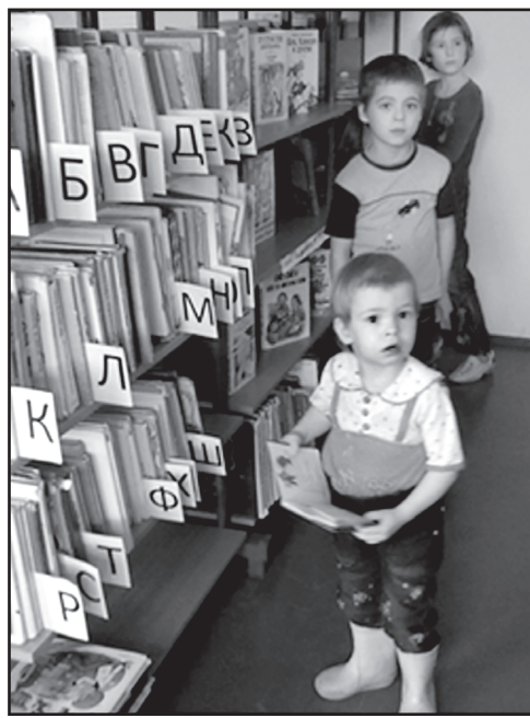
Малыши – частые гости в библиотеке