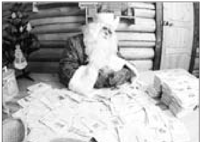
Ждём ваших писем в новом году!