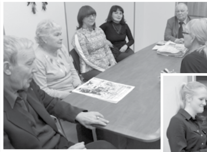
«Тобольской правды». Поделись своей радостью. Недавно я получила диплом и Благодарственное письмо Тюменской областной Думы за активное участие в фотоконкурсе «Мой любимый край. История и современность».

«Тобольской правде» я бы посоветовала открыть ещё одну рубрику, в которой уважаемые люди высказывали бы своё авторитетное мнение по любому интересному поводу.