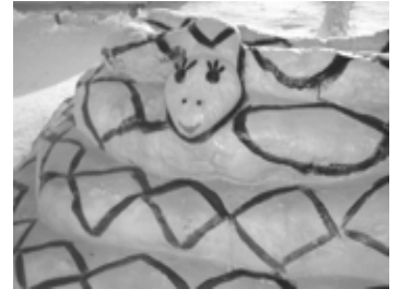
Пинигинский детский сад