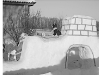
Александровский детсад № 1