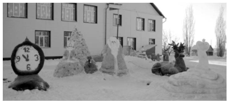
Сорокинский детский сад № 1