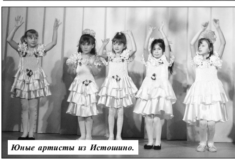
Юные артисты из Истошино.

Благодарственными письмами и грамотами за значительный вклад в развитие культуры сельского поселения и активное участие в проведении мероприятий в этот день наградили всех истошникских самодеятельных артистов. Уходили они со сцены с букетами цветов и памятными подарками.