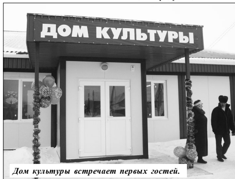
Дом культуры встречает первых гостей.