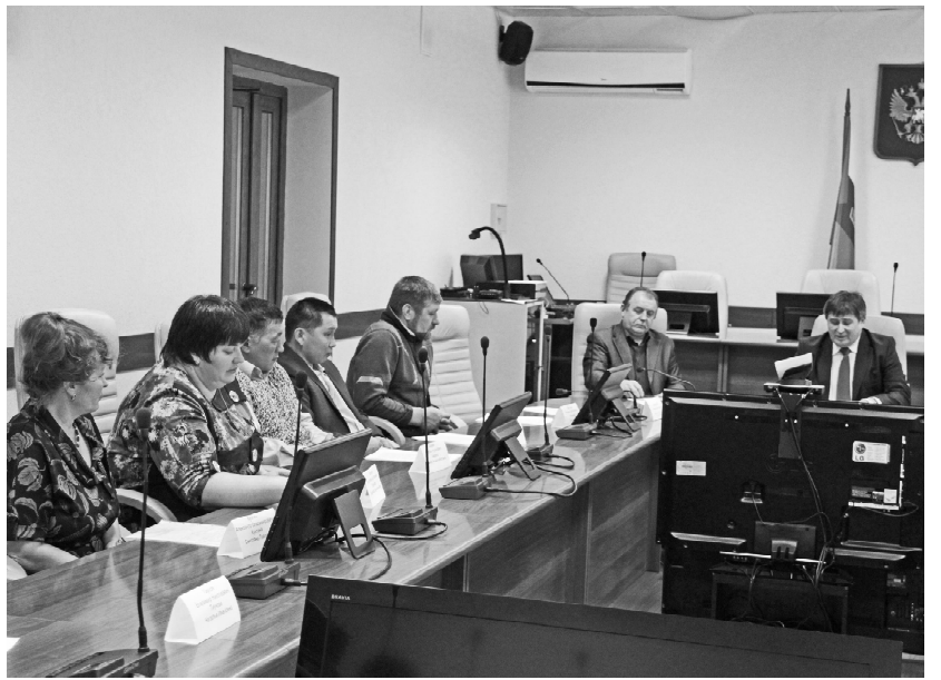
* Обсуждение в разгаре

Если же граждане по каким-то причинам не могут оформить кредит в банке, то капиталом для строительства дома они смогут воспользоваться только по достижению ребёнком трёхлетнего возраста. Мама должна обратиться к нам со стандартным перечнем документов, а также с решением на строительство. МСК де-