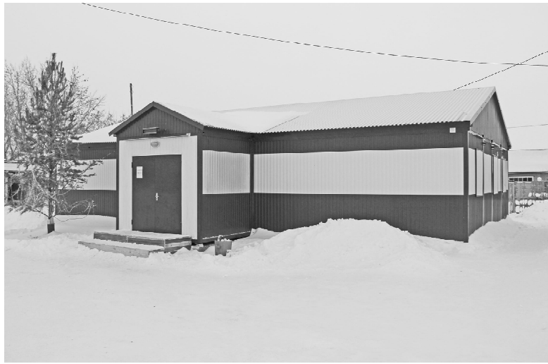
* Новый модуль

— На стадионе кроме хоккейного корта есть ещё одна ле-