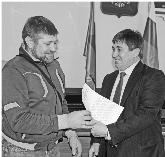
* Вручение документов

На сегодняшний день администрацией района дополнительно сформировано и поставлено на кадастровый учёт шестьдесят земельных участков: тридцать два – в восточной части села