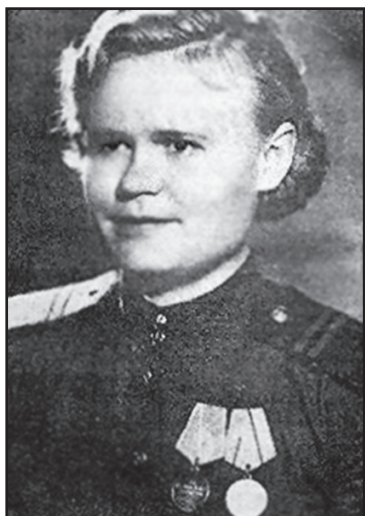
Мария Григорьевна Савицкая