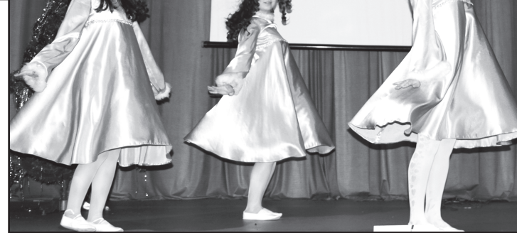
На Рождественские встречи собираются творческие школьники

программу так, чтобы у ребят была возможность «выложиться на все сто», но при этом сделать передых и вспомнить, что источником знаний по-прежнему остаётся книга. Художественным литературным произведениям был посвящён