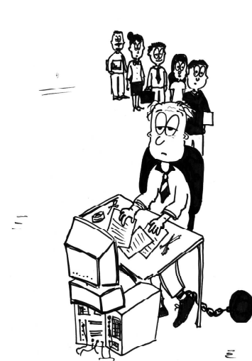
Рис. Е. ШЕВЦОВОЙ

Мы не будем анализировать ситуацию во всей стране и даже области, обратимся всего лишь к нашему району. В середине января на регистрационном учёте ГУ ТО «Центр занятости населения Викуловского района» состояло 43 безработных и 18 человек из числа ищущих работу (хотя многие безработные не обращаются к услугам центра). И только за первую рабочую неделю 2013 года в поисках работы обратились 12 человек. Из общего числа безработных 6