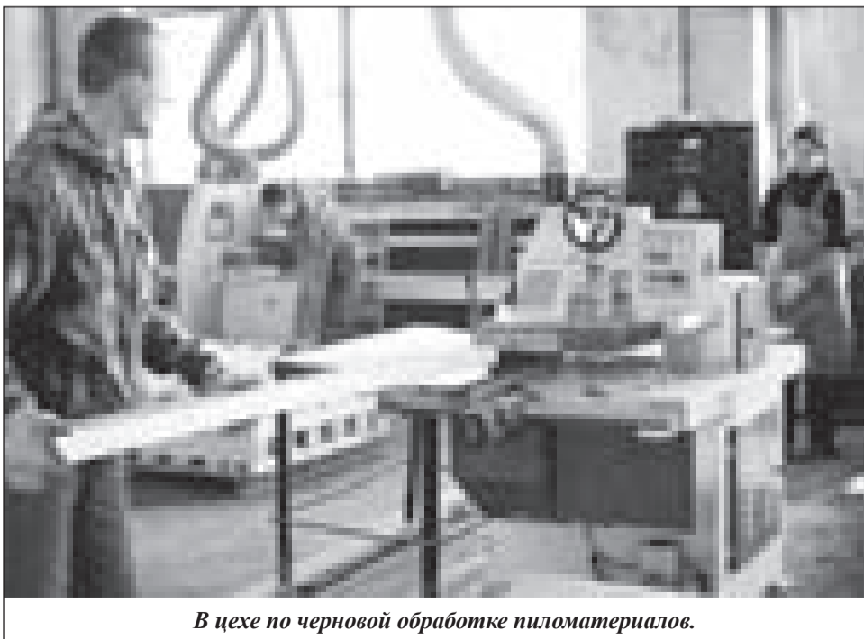
В цехе по черновой обработке пиломатериалов.