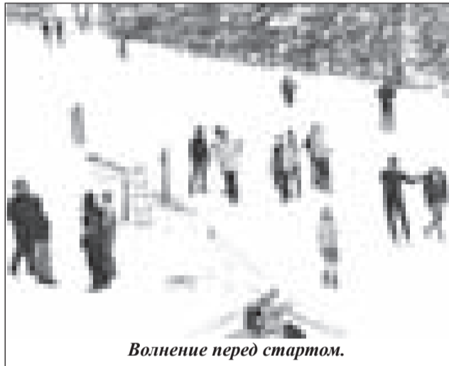
Волнение перед стартом.

познанием. Только переступая через свою боль, каждый из нас становится ещё ближе к тому, что он должен из себя представлять. «Человек познаёт себя в борьбе с препятствиями», — писал Экзюпери. И эта истина вряд ли когда-то потеряет смысл... По итогам второго этапа наша команда находится