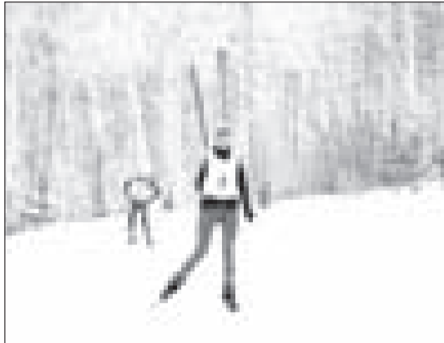
Когда соперник дышит в спину...

Только возвышаясь над собой и проходя какое-либо испытание, человек может взглянуть на себя другими глазами. Он открывает в себе иные стороны, иные грани и резервы. Это и называется