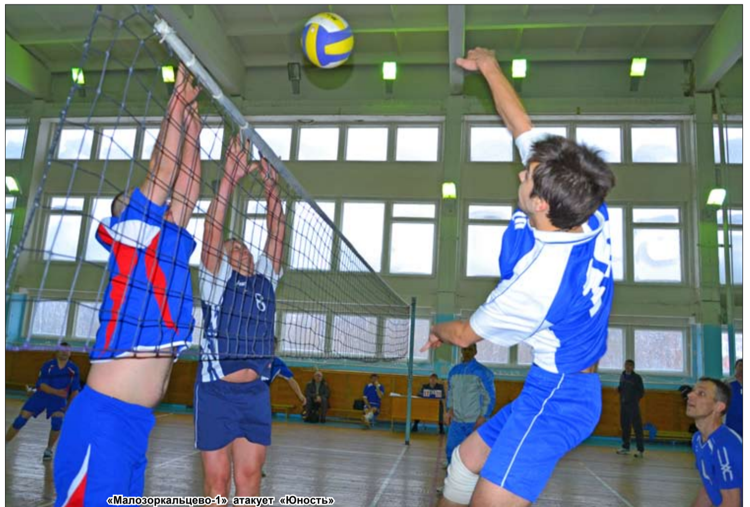
«Малозоркальцево-1» атакует «Юность»

Четверг, 31 января 2013 г. № 9 (7523) Цена 4 руб. 44 коп. Основана в 1962 г. e-mail: ssinf@mail.ru http://www.tyumedia.ru/20/