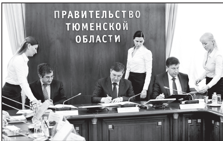
Подписание трёхстороннего договора

– По замыслу инвесторов, мощный животноводческий комплекс разместится в трёх районах – в селе Евсино Голышмановского района, селе Аромашево и селе Северо-Плетнёво. На территории