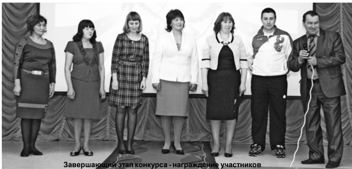
Завершающий этап конкурса - награждение участников

И грех тут не вспомнить мне аналогичные конкурсы прошлых лет, проходившие в стареньком доме культуры. И вот в связи с чем. Кроме задачи повышения профессионально – педагогической квалификации учителя, что само по себе очень важно, конкурс призван стимулировать и других учителей к реализации