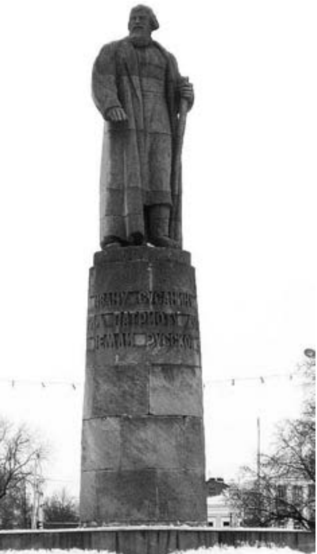
Современный монумент Ивану Сусанину в Костроме

В той грамоте был официально закреплён «статус» подвига Ивана Основиича Сусанина: «Как мы Великий Государь Царь и Великий Князь Михайло Фёдорович всея Руси в прошлом во 121 году (7121 г. от сотворения мира) были на Костроме, и в те