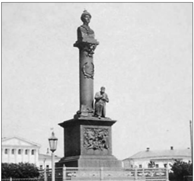
Памятник 1838 г. Михаил Романов и Иван Сусанин