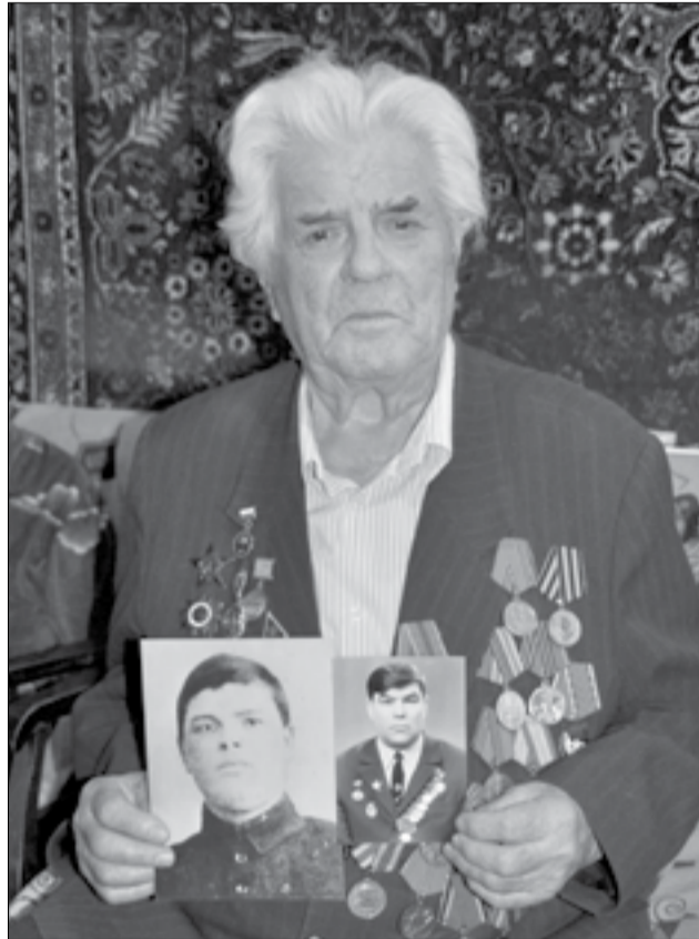
Есть что вспомнить...

В 1938 – 1939 годах леспромхоз получил большой спецзаказ на изготовление