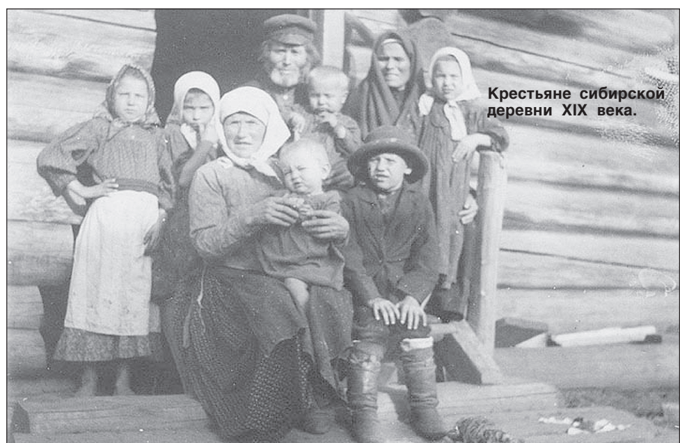
Крестьяне сибирской деревни XIX века.

Большинство жителей деревни Кулаковой были в 30-х и 40-х годах XIX века старообрядцы филипповского и федосеевского толков, хотя по записям церковным и числились православными. Церковные