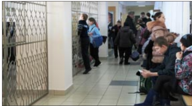
Обновлённое фойе Туртаской школы.