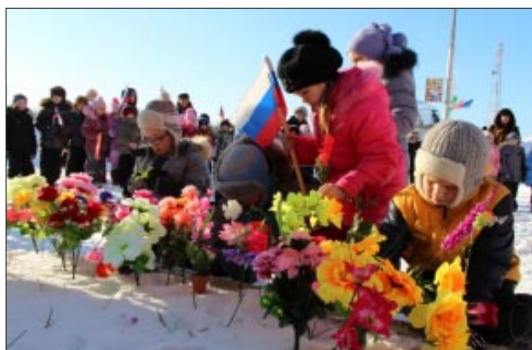
Возложение цветов к памятнику погибшим воинам.