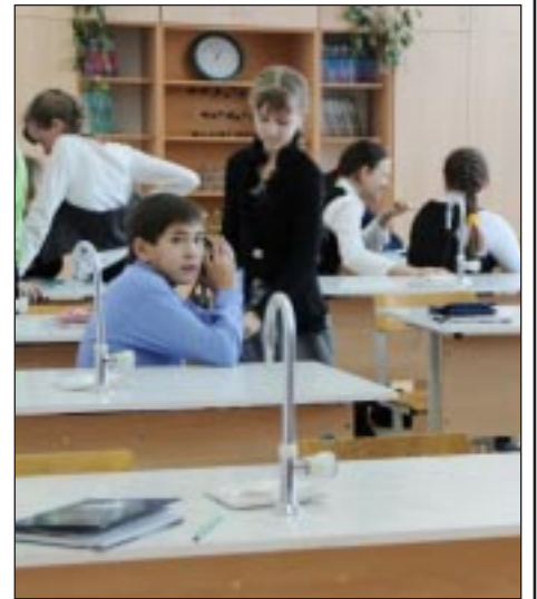
На партах в кабинете химии появились водопроводные краны.

В целом это все основные крупные виды работ, выполненные по проекту капитального ремонта здания Туртаской школы. Однако до сих пор выявляются те или иные недоработ-