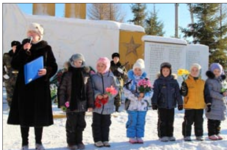
Ребята читают стихи о Сталинградской битве.