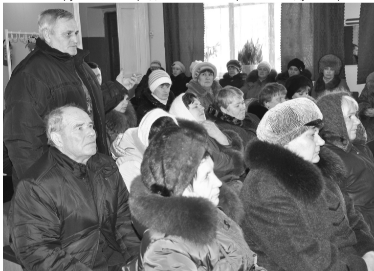
Рассветовцы задавали много вопросов по благоустройству и газификации населённого пункта