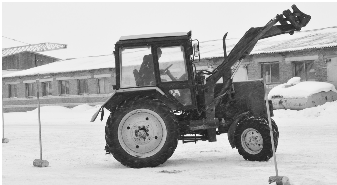
Опытным механизаторам проехать по маршруту было несложно