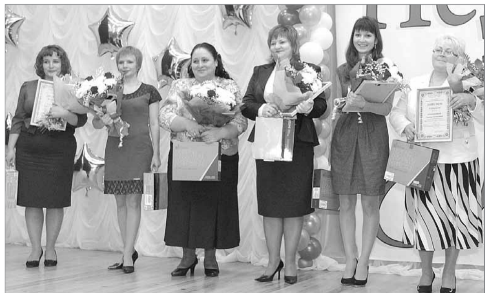
Призёры конкурса «Педагог года – 2013»