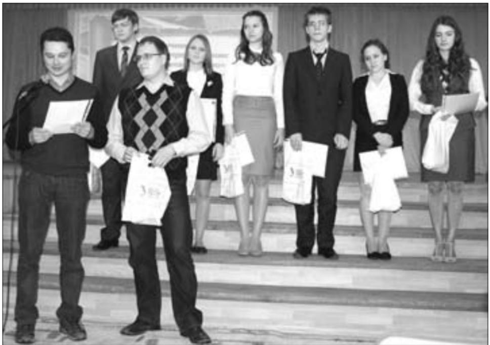
Тобольские гимназисты получают дипломы победителей и призёров из рук представителей УрФУ

«Лишь наука на земле светит людям вечно...»