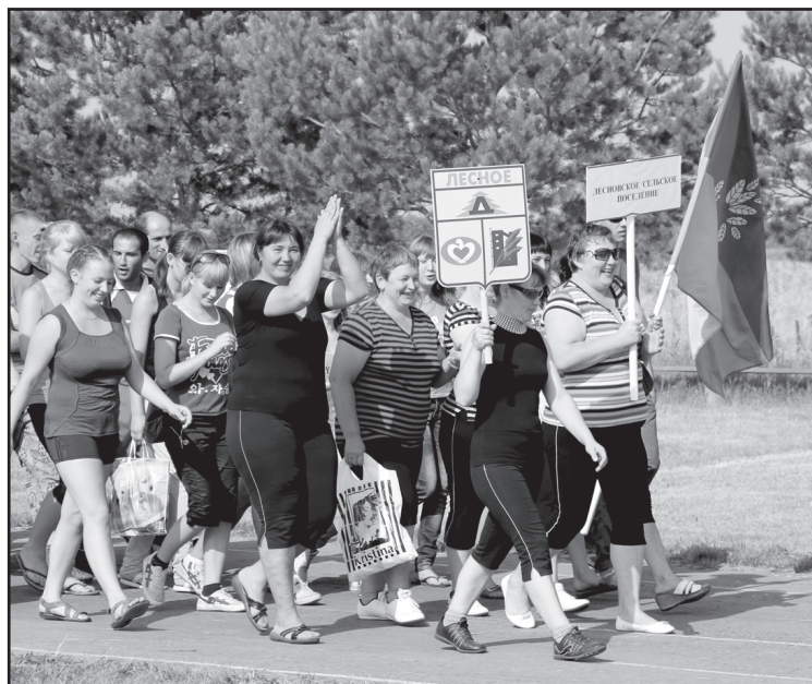
Команда с.Лесное на районных летних сельских играх в с.Володино