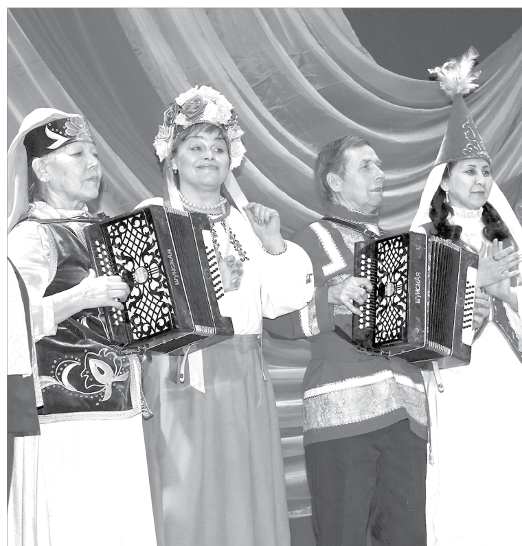
В стенах Центра национальных культур и ремёсел царит атмосфера дружбы и согласия народов