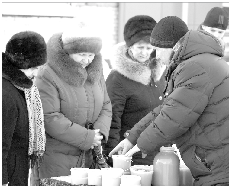
За хороший мёд никаких денег не жалко