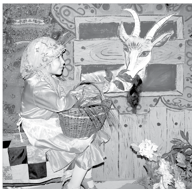
«Ожившая» картина «Девочка и коза»