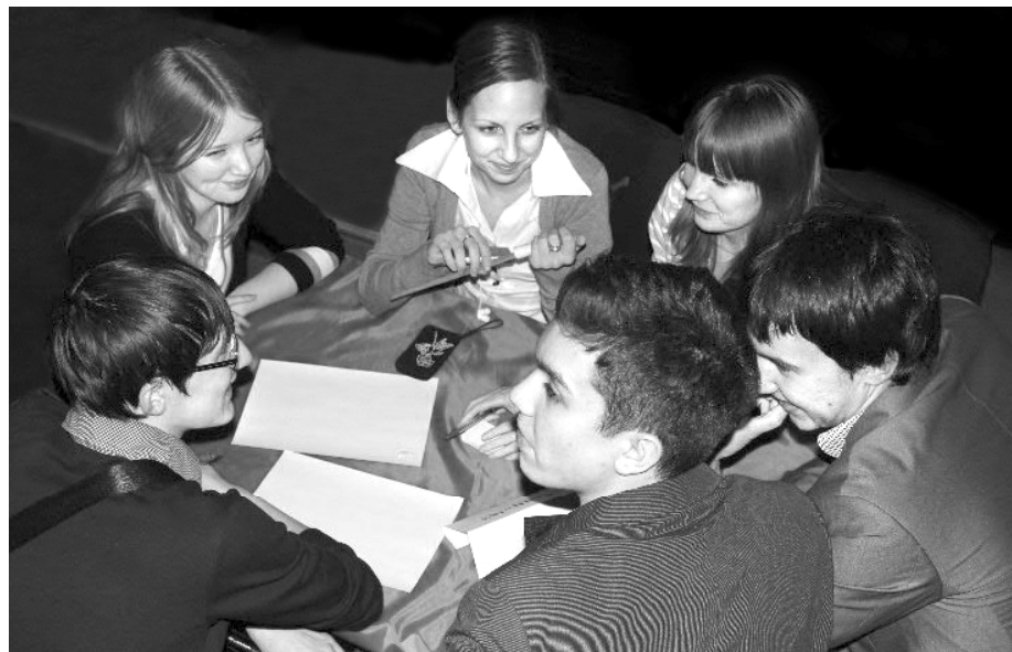
Знатоки снова в игре