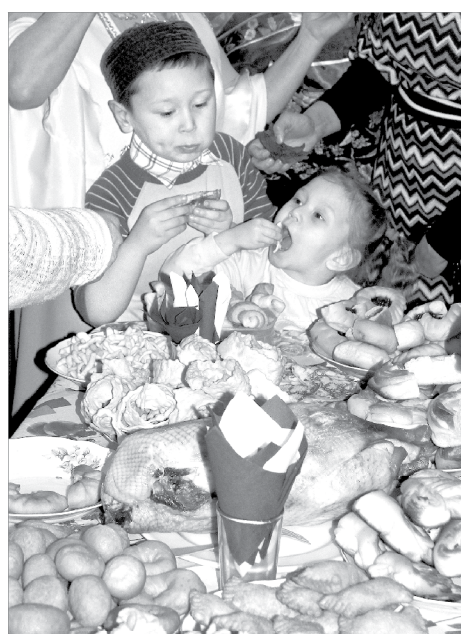
Так вкусно, что можно язык проглотить!