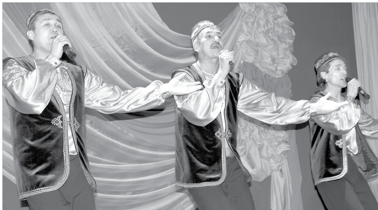
Весёлыми песнями и плясками покорила зрителей фольклорный ансамбль «Тамаша» из Асланы