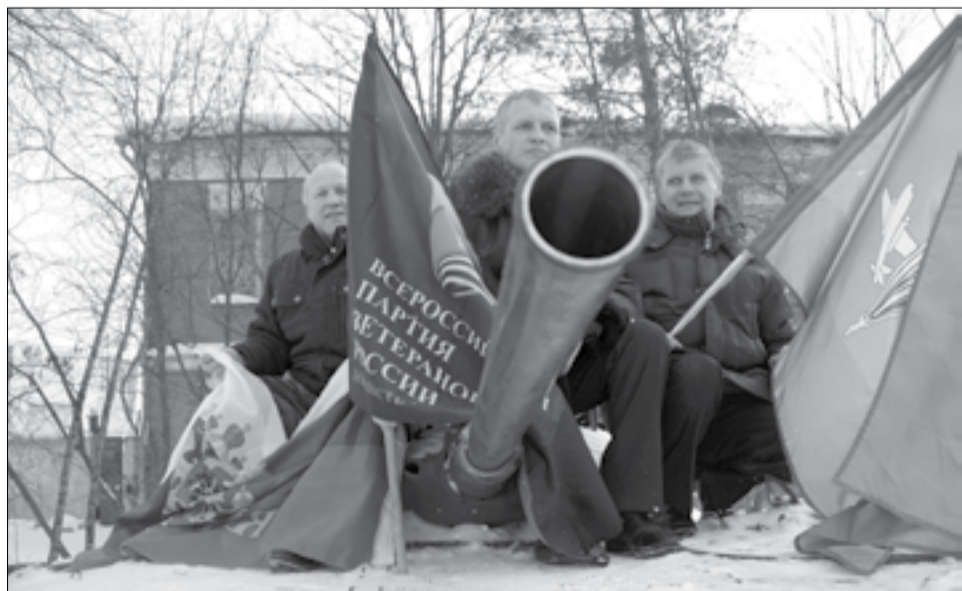
Представители «Лагара» и «Боевого братства» снова на броню

Двадцать четыре года назад, в 1989-ом, советские войска уходила из Афганистана. 15 февраля последнее подразделение 40-ой армии прошло по мосту «Дружба» через Амударью, и генерал-лейтенант Б. В. Громов заявил: «За моей спиной не осталось ни одного советского солдата».