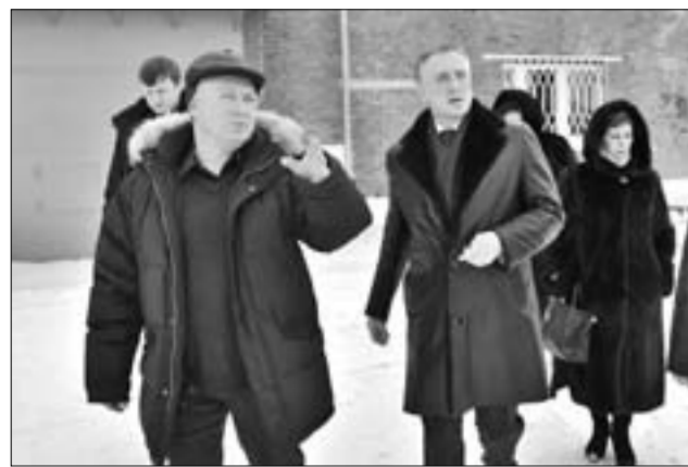
(Окончание. Начало на 1 стр.)

– Надо изучить этот вопрос, – отметил глава. – Если объект может работать не