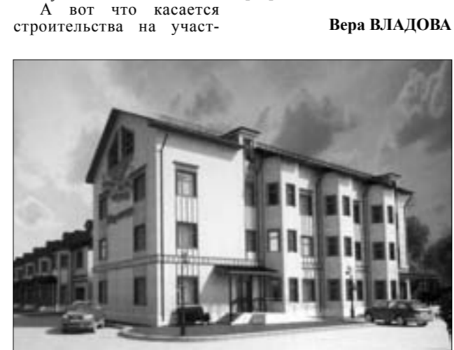
Проект будущего дома на Революционной

А вот что касается строительства на участ-