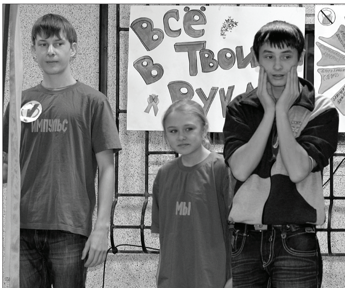
Вот так задачка... Непростые вопросы ведущего мастер-класса «Сессии здоровья» заставляли ребят поволноваться.

На второй площадке показывали мастер-класс, где участники проводили со зрителями заранее подготовленную профилактическую игру. А на третьей шла презентация профилактического социального проекта. Кроме этого, волонтерским отрядам предоставлялась возможность поучаствовать в специально выделенной номинации «Электронная пре-