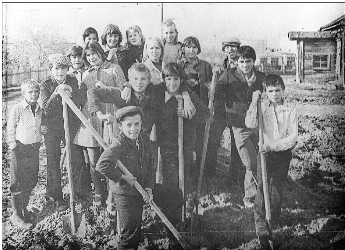
1982 год. Дружный трудчас по уборке территории школы-интерната.

В 60-70 гг. контингент учащихся формировался из воспитанников Ембаевского детского дома, Тюменского детского дома № 69. Дети в первые дни чувствовали себя неуютно, грустно, и первое «лекарство» от переживаний для них был поход на природу.