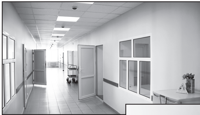
В отремонтированном детском отделении больницы