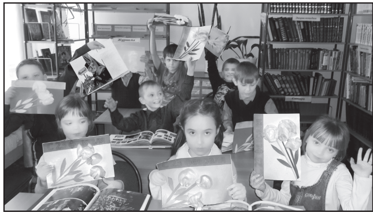
Ребята своими руками сделали открытки, чтобы поздравить пап