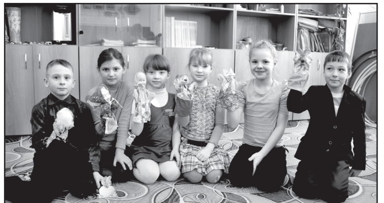
Творческое занятие по театрализации в рамках ФГОС