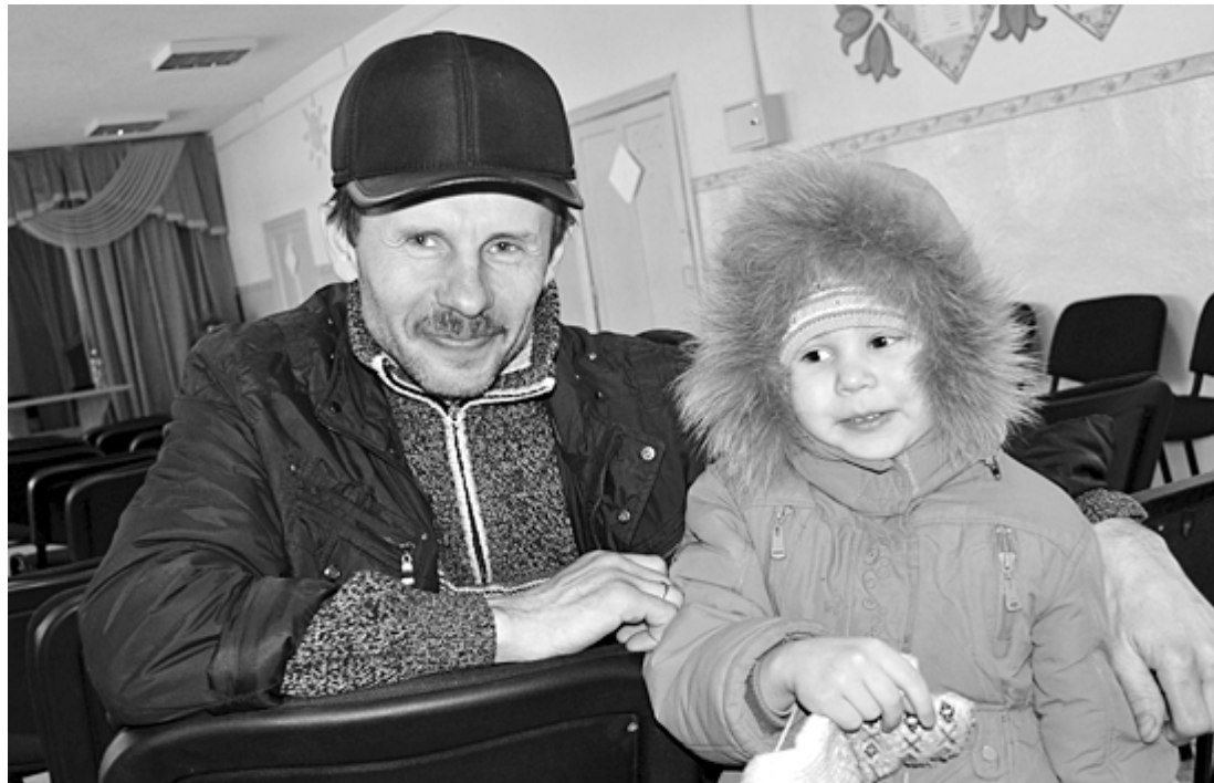
Фото и текст Сайда Абу Бычковой.

стигивая её меха, напевает любимую украинскую народную песню «Распрягайте, хлопцы, коней». В свободное время принимает участие в художественной самодеятельности СДК, ходит вместе с друзьями на охоту, занимается атлетическим бегом. В юности увлекался волейболом, ездил на районные соревнования.