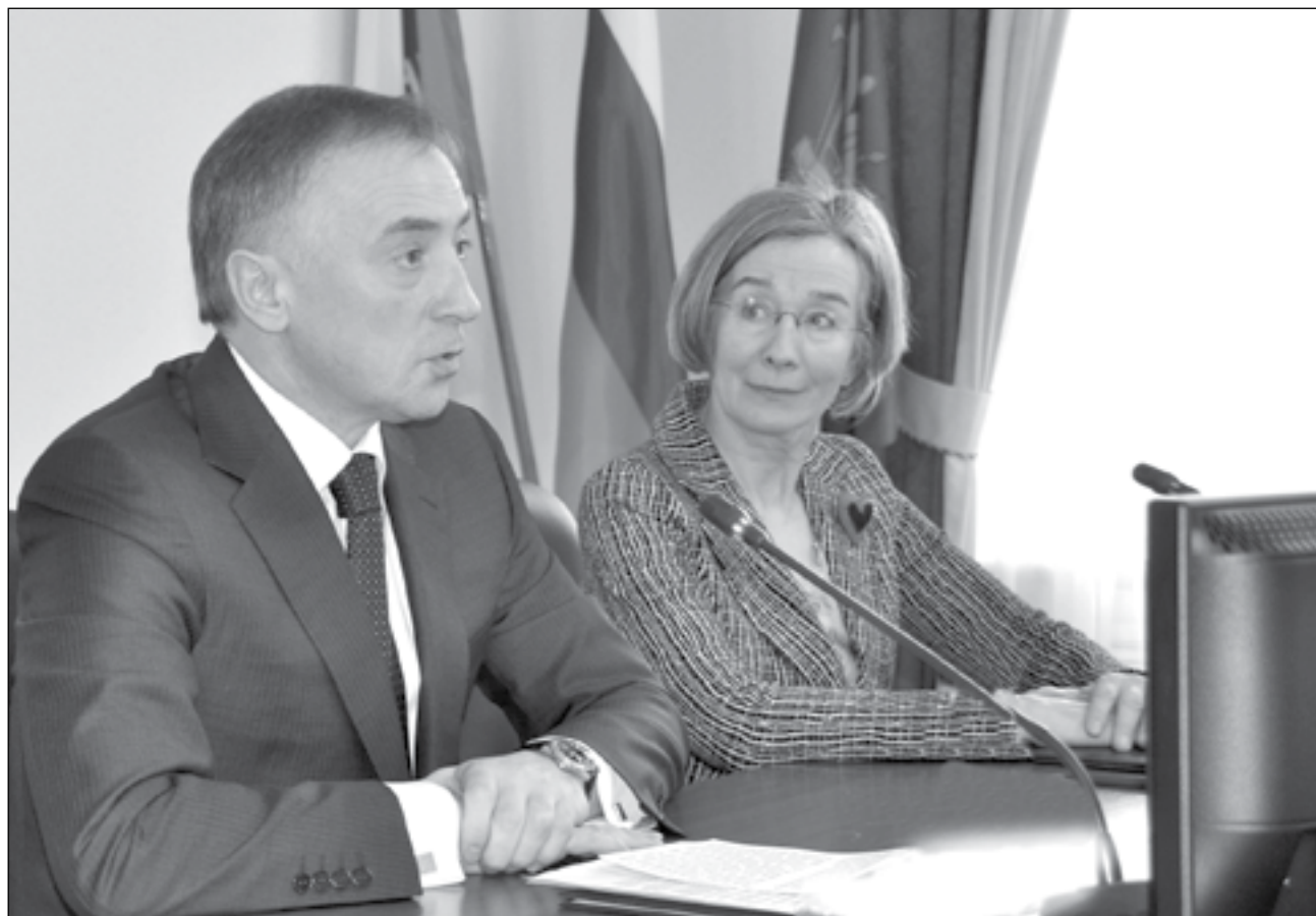
Глава администрации Тобольска Владимир Мазур и Чрезвычайный и Полномочный Посол Королевства Швеции в Российской Федерации Вероника Бард Брингеус

В минувшие выходные Тобольск встречал шведскую делегацию во главе с Чрезвычайным и Полномочным Послом Королевства Швеции в Российской Федерации Вероникой Бард Брингеус.