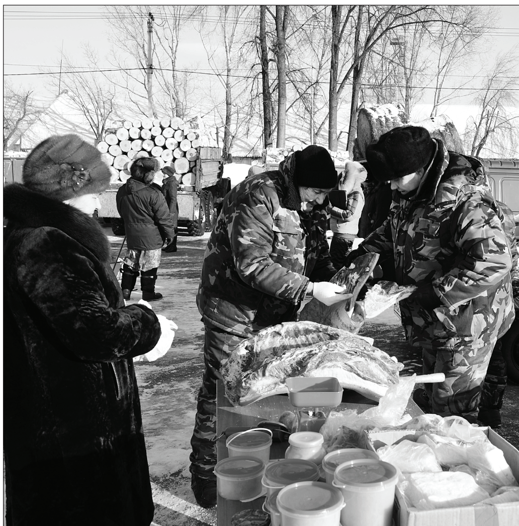
Вот уж где было к чему присмотреться и тут же приобрести. Вроде как и зима заканчивается, но мясо в Сибири всегда в ходу. Тут тебе и сало, пожалуйста, и мёд, и много всего прочего.