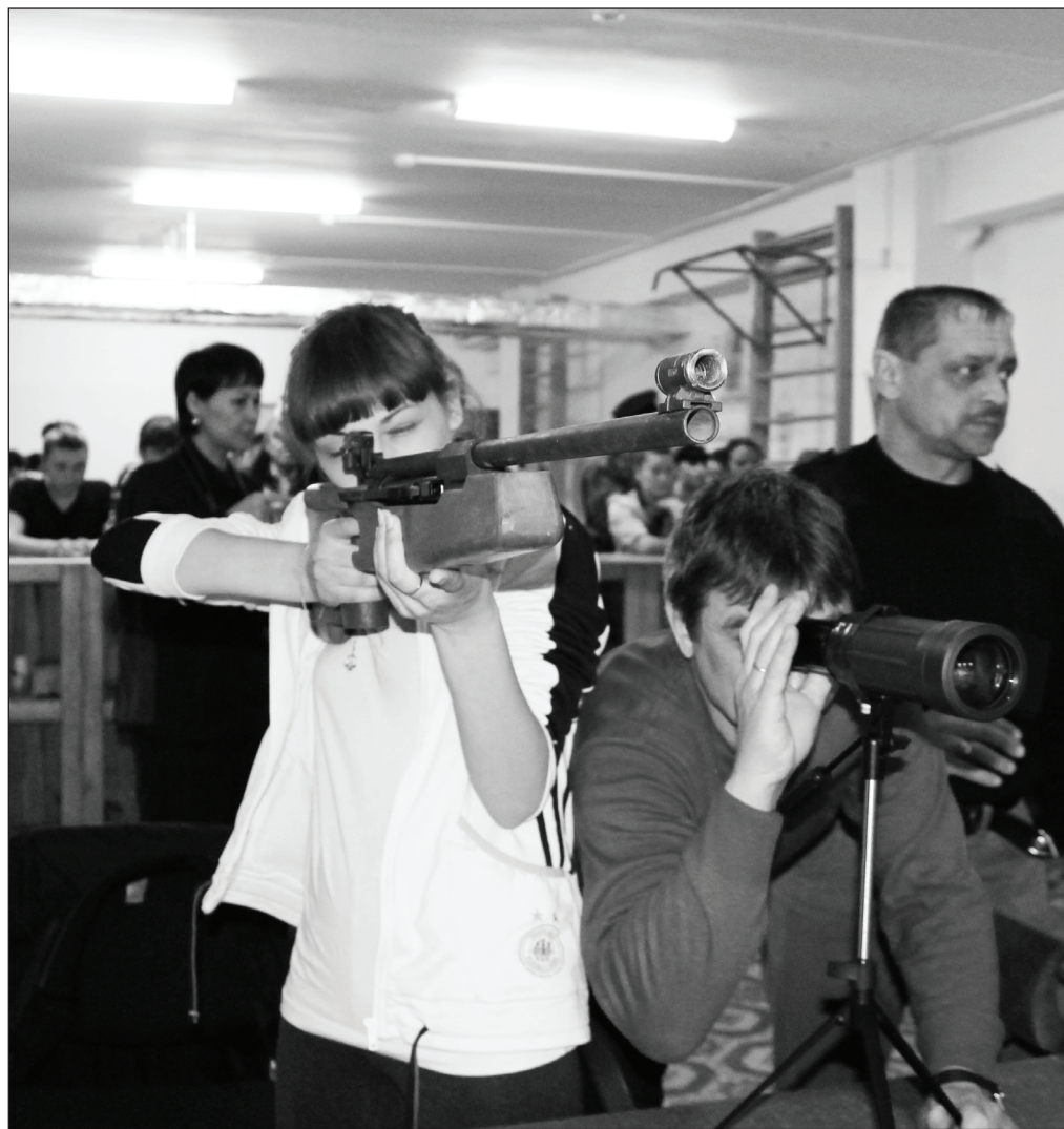
И у нас среди девушек есть отличные стрелки.