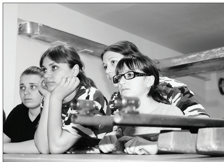
А интересно-то как девчонкам из г.Тавда, что там такое выдвывают соперницы.

стало ясно, что организаторы подошли к подготовке основательно. А уж когда «живой» духовой оркестр Тюменского муниципалитета при выносе знамён грянул «Встречный марш», честно говоря, где-то внутри что-то зашекетало и от обычной при таких церемониях официальности и натянутости не осталось и следа, зато появилось ощущение праздника.