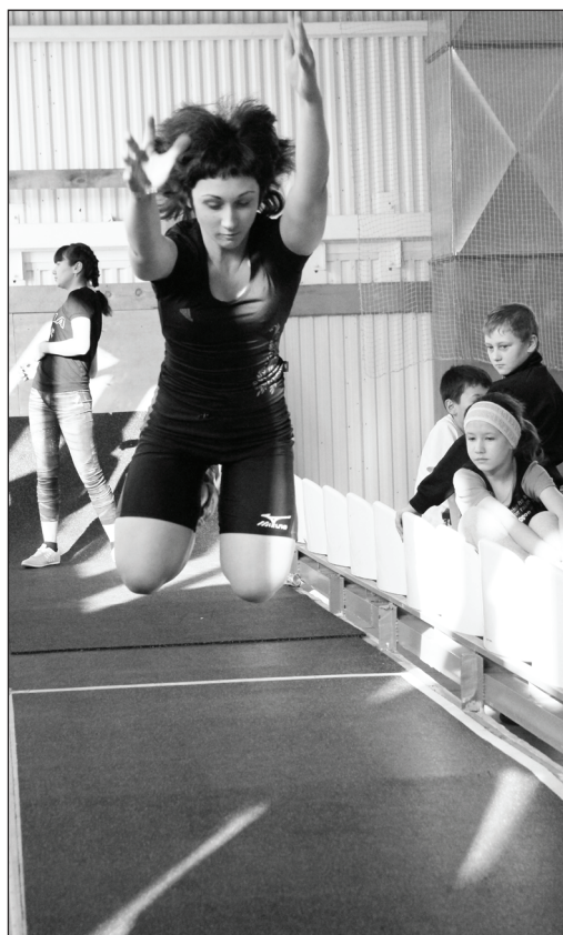
А ну-ка, прыгни за полтора метра с места.

Ещё на торжественном открытии и параде команд-участниц