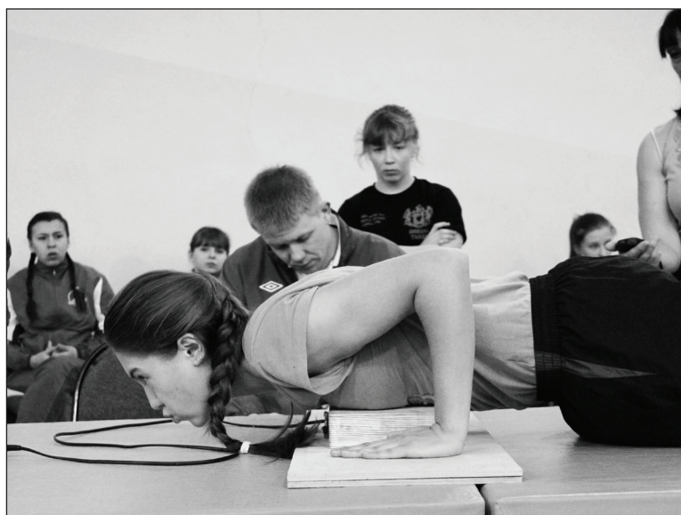
30, 31, 32... попробуй, отожмись больше.